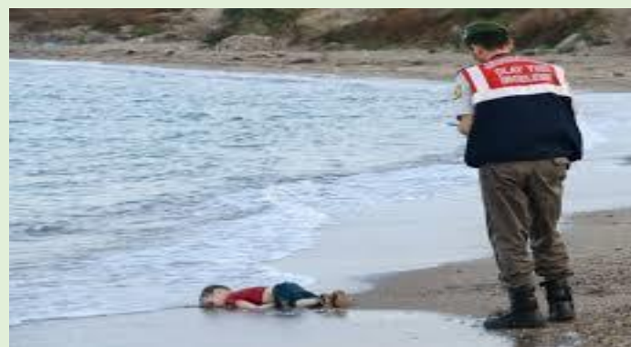
A tragédia humanitária no Mediterrâneo e na Europa

DIA 4 DE OUTUBRO É PRECISO DERROTAR A POLÍTICA DE DIREITA, E ELEGER QUEM REALMENTE DEFENDE OS TRABALHADORES!